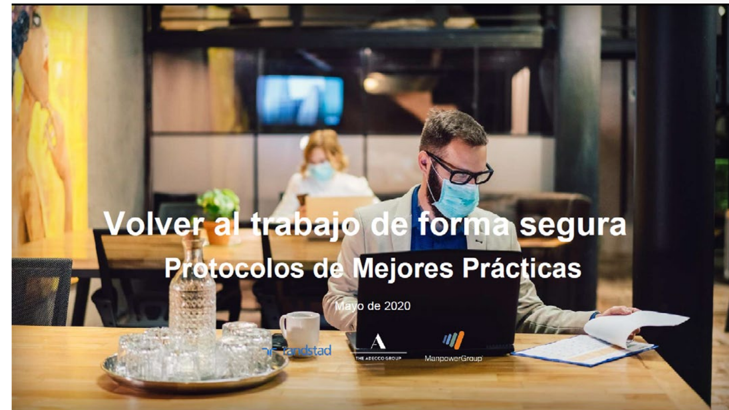
Volver al trabajo de forma segura: Protocolos de Mejores Prácticas