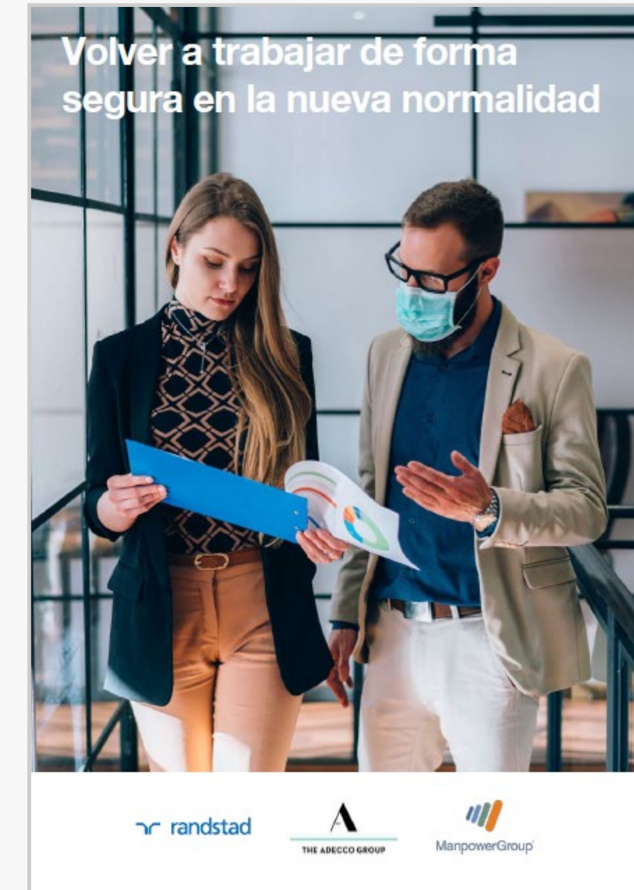
Volver al trabajo de forma segura. Protocolos de mejores prácticas