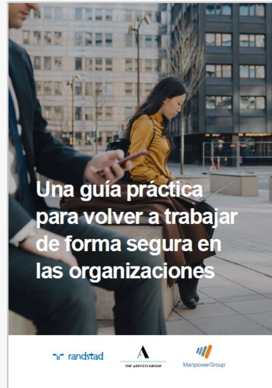
Una guía práctica para volver a trabajar de forma segura en las organizaciones